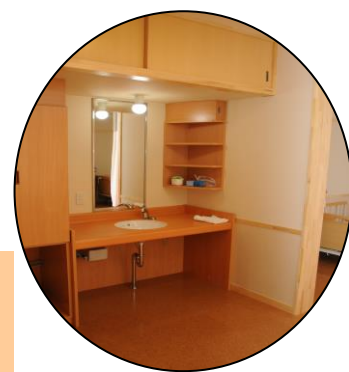
格安の利用料の二床室にも、ゆとりの空間を創り出す創意と工夫が施されています。