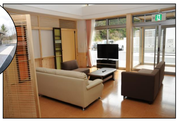
ゆとりの共同生活室は、ユニットで生活されるみなさんの「お茶の間」です。思い思いにくつろいでいただける空間を演出します。