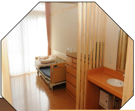
ユニットの個室には洗面台とトイレがあり、馴染みの家具などを持ち込んでも、ゆとりのある空間を提供します。