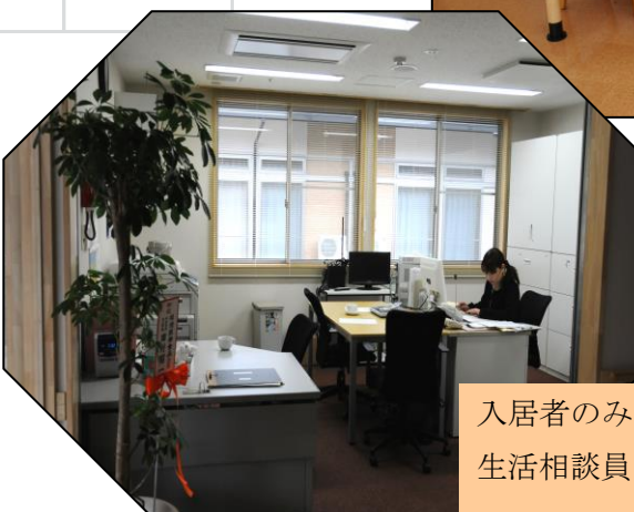
入居者のみなさんの様々なお相談に生活相談員がお応えします。