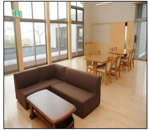
日当たりが良く、広々としたパブリックスペースでは四季折様なイベントが企画されます。