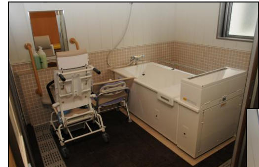
お風呂は個浴を基本とし、ゆったりと入っていただけます。